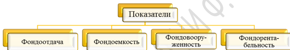
Рисунок 1 – Показатели, характеризующие эффективность использования основных средств [1, с. 87]

В целом, прежде, чем повышать эффективность, необходимо ее оценить. Можно провести комплексный анализ показателей основных средств (рисунок 1) и сделать соответствующие выводы.