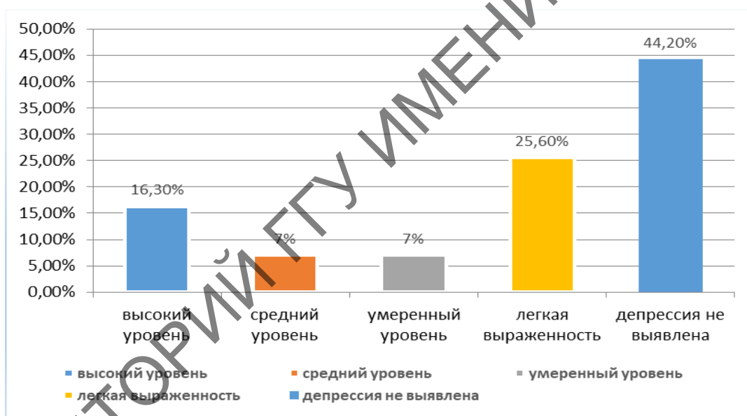
Рисунок 2– Уровни депрессивной симптоматики студентов

Уровни депрессивной симптоматики студентов представлены в рисунке 2.