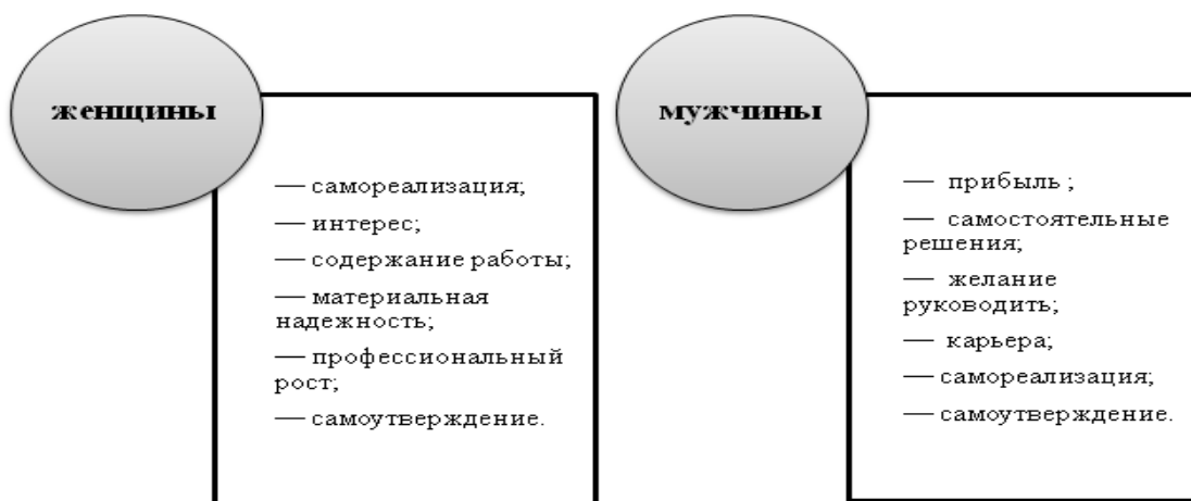
Рисунок 2 – Мотивационные шкалы управления мужчин и женщин

В структуру мотивации политического поведения женщины в качестве одного из слагаемых помимо потребностей входят и ожидания индивидов и социальных групп. Главной субъективной характеристикой социального статуса являются социальные ожидания в отношении самого себя и другого, связанные с социальными стереотипами. У. Липпман понимает под социальными стереотипами картинку мира в голове человека, которые экономят его усилия при восприятии сложных социальных объектов и защищают его ценности, позиции и права. Представляется, что данное определение релевантно для выявления гендерных стереотипов поведения мужчины и женщины. Гендерные стереотипы – стандартизированные представления о моделях поведения и чертах характера, соответствующие понятиям «мужское» и «женское» – культурно и социально обусловлены, формируются исходя из тех социальных ролей (ожидаемых образцов поведения), исполнение которых предписано обществом мужчине и женщине [3].