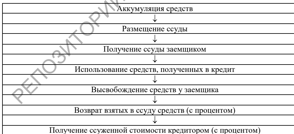
Рисунок 2 – Стадии движения кредита

Стадии движения кредита представлены на рисунке 2.