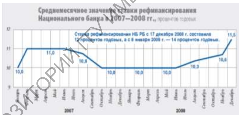
Рисунок 4 – Среднемесячное значение ставки рефинансирования Национального банка в 2007-2008 гг.

Складывающаяся экономическая и финансовая ситуация в Республике Беларусь потребовала определенной корректировки процентной политики. Учитывая более высокий уровень инфляции, чем прогнозировалось, Национальный банк с середины 2008 г. начал постепенно повышать ставку рефинансирования, доведя ее с 17 декабря 2008 г. до уровня 12% годовых, а с 8 января текущего года – до 14%. Параллельно росли ставки депозитно-кредитного рынка (рисунок 4).