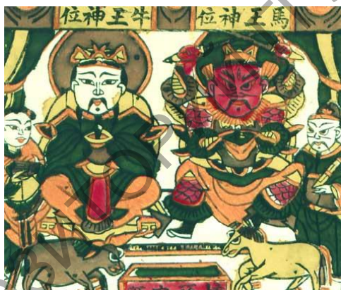
Ню Ван и Ма Ван со своими слугами

Важно отметить, что китайцы обычно помещали изображения Ню Вана в тех местах, где находятся домашние животные: «В Китае в XVIII – начале XX вв. были широко популярны лубочные антропоморфные изображения Ню-вана (иногда вместе с Ма-ваном – покровителем лошадей), которые размещали подле конюшни или в помещениях для скота с охранительной целью» [4, с. 538]. В этой традиции можно видеть выразительную параллель с нахождением в хлевах и загонах для скота у восточных славян икон св. Власия. На благопожелательной картинке няньхуа у ног Ню Вана изображена корова, а у ног Ма Вана – лошадь.