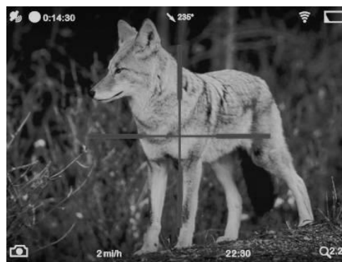
Рисунок 2 – Внешний вид волка через прицел ночного видения

Наиболее затратным методом охоты на волка является охота на приваде (таблица 1). Для создания комфортных условий охоты желательно проводить такие охоты с использованием вышек. Это удорожает расходы. Согласно реальному наряду-акту на производство работ по выполнению биотехнических мероприятий по лесохозяйственному хозяйству ГЛХУ «Хойникский лесхоз», составленному 10.02.2017 г., строительство такой вышки обошлось в 596,2 белорусских рублей. Но это без учета оплаты труда двух человек в течение 5 дней. В целом, стоимость создания одной вышки можно оценить в пределах 1000 белорусских рублей.