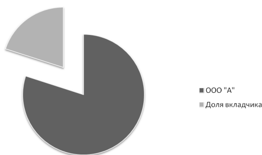
Рисунок 1 – Доля вкладчика ООО «А» до передачи ее ООО «Б»