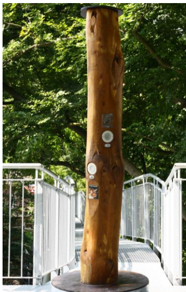
Рисунок 2. “Поющее дерево”