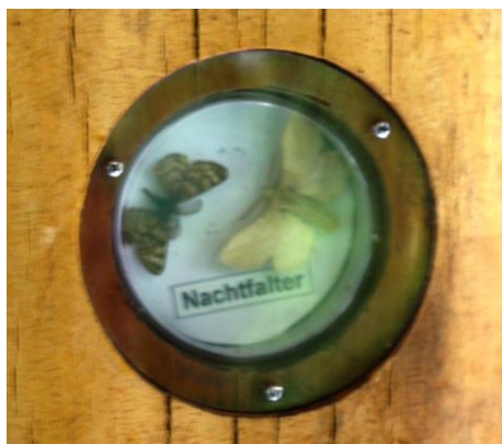
Рисунок 3. Размещение насекомых в дереве

Важно отметить и то, что экологическая тропа задумана и функционирует как гармоничная, хотя и небольшая, часть парка, включающего красивый замок XVIII века, многочисленные детские аттракционы, прокат лодок, катамаранов и др. Предоставление широкого спектра услуг в сочетании с невысокой стоимостью входных билетов обеспечивают большое количество посетителей в сезон работы парка.