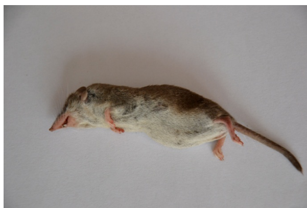
Рисунок 4 – Cr. Suaveolens , найденная в ботаническом саду 28.06.2023

Третья особь белозубки (рисунок 4) была добыта 28.06.2023 также на территории ботанического сада ВГМУ, в центральной его части (в 125 м от предыдущей находки).