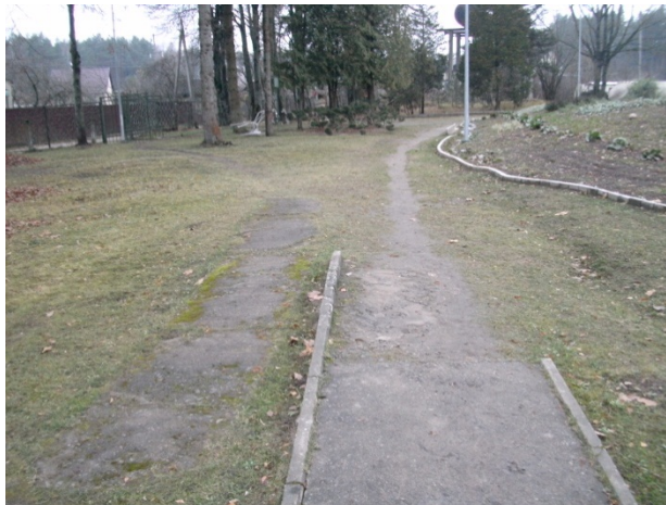
Рисунок 3 – Место находки второй особи Cr. suaveolens (ботанический сад ВГМУ)

Территория ботанического сада (основан в 1968 г.) занимает 5 га и находится среди частной дачной застройки в 1,1 км от р. Зап. Двина. В 30–40 м от зап. границы сада начинается смешанный хвойно-широколиственный лес (основные древесные породы – сосна обыкновенная ( Pinus sylvestris ), ель европейская ( Picea abies ), осина обыкновенная ( Populus tremula ), береза повислая ( Betula pendula ), дуб черешчатый ( Quercus robur )), простирающийся практически до берега реки.