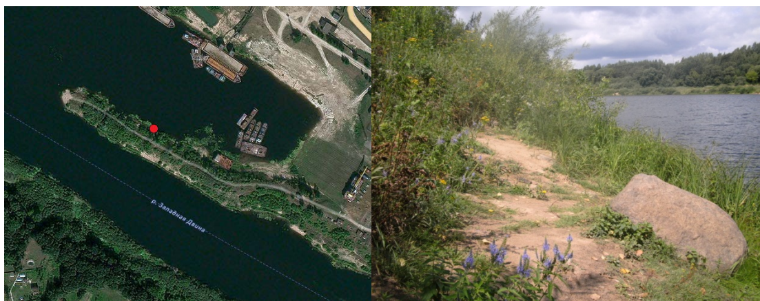
Рисунок 1 – Место поймки первого экземпляра и биотоп Cr. suaveolens в окр. порта г. Витебска

росшей древесно-кустарниковой растительностью (проективное покрытие около 70 %) с пятнами лугового и прибрежного водно-болотного разнотравья. Основные древесные породы насыпи – это облепиха крушиновидная ( Hippóphaë rhamnóides ), образующая местами непроходимые заросли 2–2,5 м высотой, ясень обыкновенный ( Fráxinus excélsior ), ива ( Salix sp. ), единичные экземпляры березы ( Betula sp. ). Травянистая растительность представлена различными видами злаков (на суходольных, возвышенных местах), прибрежными водно-болотными видами (в месте поймки Cr. suaveolens ) – осокой ( Carex sp. ), чистецом болотным ( Stachys palustris ), горцем перечным ( Persicária hydropíper ), сусаком зонтичным ( Butomus umbellatus ) и др. Следует отметить, что дамба порта каждый год в весеннее половодье укорачивается примерно на 30 %, уходя под воду, и вновь приобретает прежнюю длину и высоту ближе к середине мая.