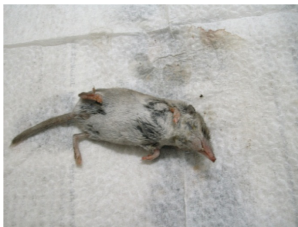
Рисунок 2 – Экземпляр белозубки малой, найденный на территории ботанического сада 19.10.2022

Второй экземпляр Cr. suaveolens (рисунок 2) был обнаружен 19.10.2022 в микрорайоне Улановичи (г. Витебск), на территории ботанического сада ВГМУ (Витебский государственный ордена Дружбы народов медицинский университет) в 7 км к северо-востоку от первой находки (координаты: 55.2224 0 с.ш., 30.1538 0 в.д.). Белозубка была найдена мертвой на краю бетонной дорожки в 15 м от административного здания учреждения (рисунок 3).