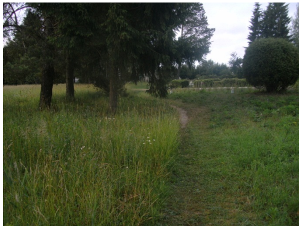
Рисунок 5 – Место обнаружения третьего экземпляра Cr. suaveolens (ботанический сад ВГМУ)

Зверек найден мертвым на дорожке вблизи группы хвойных деревьев (ель европейская ( Picea abies ), сосна обыкновенная ( P. sylvestris )) среди разнотравного луга (рисунок 5). Ввиду наличия небольшой ранки на боку, землеройка, как и в первом случае предположительно добыта кошкой. Метрические характеристики данной особи: длина тела – 63 мм; длина хвоста – 32 мм; длина ступни – 11,8 мм; длина уха – 5,1 мм; кондилобазальная длина – 16,8 мм; ширина черепа – 8,1 мм; скуловая ширина – 5,7 мм; высота нижней челюсти – 4,3; масса тела – 9 г.