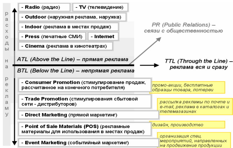
Рисунок 3 – Классификация маркетинговых коммуникаций по принципу прямого или косвенного воздействия на потребителя

Разделение на ATL и BTL подразумевает характер воздействия на потребителя. Прямая реклама (ATL) оказывает прямое воздействие на потребителя, т. е. сама компания размещает информацию в СМИ, тем самым обеспечивая прямое воздействие на аудиторию. Тогда как BTL воздействует через специальные мероприятия, дистрибьюторов и прочие косвенные инструменты.