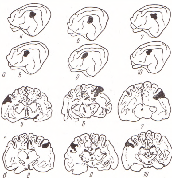
Рис. 1. Локализация повреждения поля A_1 мозга чопек № 4—10. а — на латеральной поверхности, б — на фронтальных срезах через уровень максимального повреждения

сильвиевой извилинами. Обращало на себя внимание то, что многие из этих волокон входили в состав пучков, выстилающих дно соответствующих борозд. Однако часть волокон в виде длинных радиальных пучков направлялась к вершинам извилин, проникая в толщу слоев 6 и 5. На уровне этих слоев распавшиеся волокна были преимущественно среднего калибра. В слое 5 между пучками вертикальных дегенерированных проводников встречались единичные распавшиеся претерминальные волокна