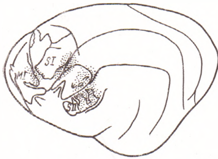
Рис. 3. Распределение терминальных полей межсенсорных связей слухового поля A_1 на соматотопической карте (14)

участки соответствовали проекциям задней половины головы, темени и передней лапы (рис. 3). В зоне СИ имело место более диффузное распределение претерминалей. Однако