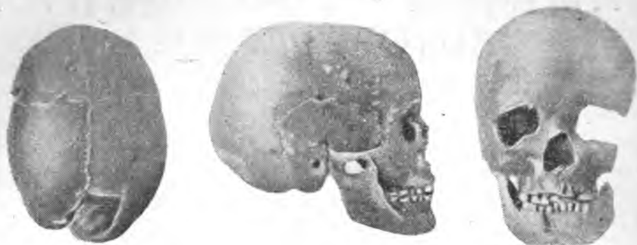
Рис. 1. Тип гуннов (усуней)

4. № 72, К-10. Обломки черепа старческого возраста. Черепная коробка с угловатым затылком, возможно, мезо- или долихокранная.