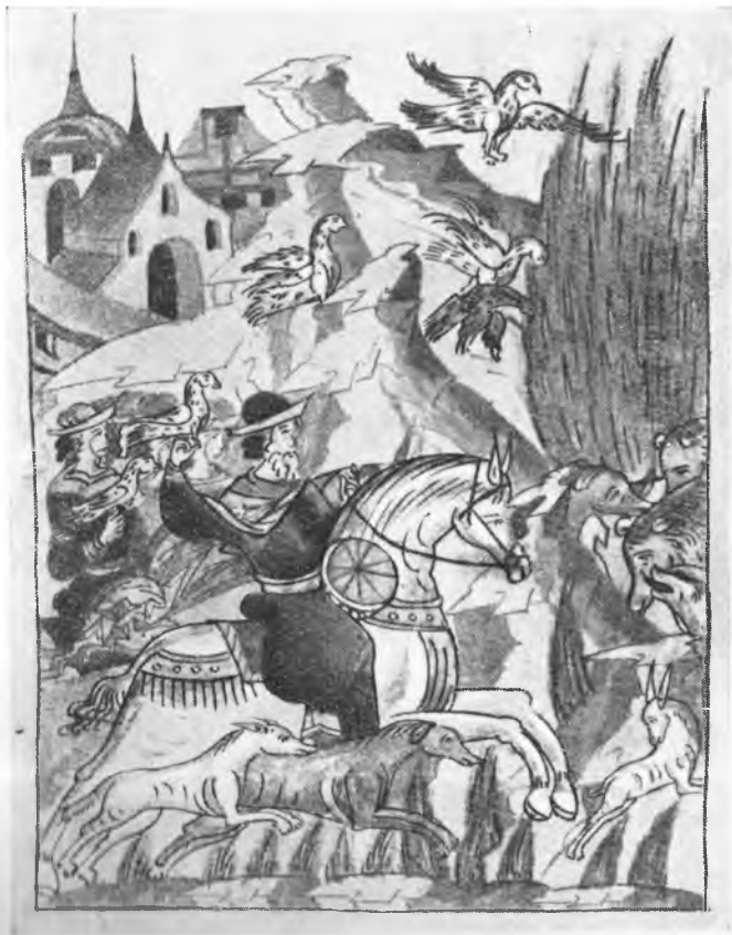
Рис. 11. Сокольная охота. На шею коня висит бубен. Миниатюра Никоновской летописи (II Остермановский том, стр. 1620)