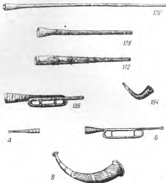
Таблица II. Народные духовые инструменты. Амбурные

пастушьи трубы из б. Смоленской, Могилевской, Тамбовской и Олонецкой губерний (№№ 176—178, 180, 182 и 183), кавказскую горотото, или саквири (№ 171), среднеазиатский карнай (№№ 169 и 170) и бурятскую голин-буре (№№ 166—168) (см. табл. II) 49 . В. А. Мошков отмечает подобные же трубы у сербов-лужичан 50 . Длина этих труб от 1,16 м до 2,5 м, а в отдельных случаях даже до 4 м. Встречаются и металлические и деревянные трубы. Пастушьи трубы с оборотом, но не металлические, а деревянные, составленные из нескольких колен и оплетенные берестой, встречены в б. Олонецкой, Вологодской и Могилевской губерниях (№№ 186—187) (см. табл. II) 51 . Длина их достигает