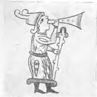
Рис. 7. Заглавная буква Р из Новгородского евангелия XIV в.

Другая группа амбушюрных музыкальных инструментов, бытующих до настоящего времени, — пастушьи и охотничьи рожки — также встречается в исследуемом нами материале.