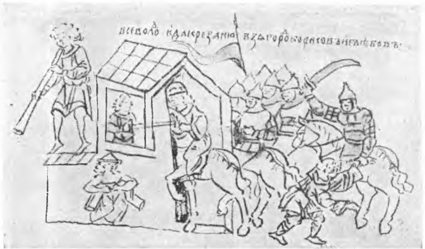
Рис. 3. Боевая сигнальная труба. Штурм г. Рязани Всеволодом Большое гнездо. Миниатюра Кенигсбергской летописи (л. 227 об.)

Сигнал к началу боя или приступа подавался, как правило, одновременным, сильным и дружным звучанием всех «военных сигнальных инструментов», как это описано в приведенной выше цитате из записок Герберштейна. Например, князь Святослав, готовясь к штурму города Болгара на Волге (1220), «повеле всем вооружиться, и стяги наволочив, изрядив полки в насадах и удариша в накры и в органы, и в трубы, и в зурны, и в посвистели» 16 . Сигнал к штурму