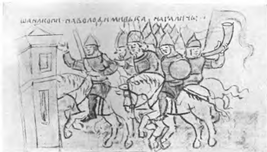
Рис. 8. Русское войско на походе. Виден сигнальный рог. Миниатюра Кенигсбергской летописи (л. 173. об. нижн.).

хранится несколько таких рогов. Рог Тулузского музея предание приписывает самому Роланду; рог, хранящийся в Аахенском соборе — Карлу Великому 58 . Олифант брата Карла Великого, Карломана, находится в Брюссельском музее. Этот рог длиной 0,59 м, с украшениями из золота, очень похож на изображение рога Роланда, имеющееся в рукописи, датированной XIV в. 59 Олифант с богатой серебряной накладкой с изображениями сцен охоты и сражений (XI в.) принадлежит Копенгагенскому музею 60 . Охотничьи и военные сюжеты были, кажется, излюбленными украшениями рогов. Вспомним, что накладной серебряный орнамент одного из турьих рогов-ритонов, найденных в «Черной могиле» — погребении славянского князя X в., — также содержит