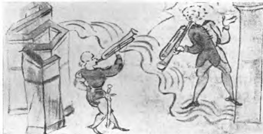
Рис. 2. Боевые сигнальные трубы. Миниатюра Кенигсбергской летописи (л. 207 об.)

Нам известны случаи подачи сигналов при помощи труб отрядами, находившимися на разных берегах реки. Об одном из них — об осаде печенегами Киева еще в 968 г. 12 — подробно рассказано в наших летописях. Извещенные осажденными в городе о безвыходном положении и необходимости немедленной выручки, стоявшие на другом берегу реки воины воеводы Притича рано утром уселись в насады и «вѣструбиша вельми, и людье во граде кликнуша» 13 . Трубный звук, раздавшийся из ладей был, как видно, подхвачен трубачами в городе (трубачи эти изображены на приведенной нами миниатюре — рис. 1). Печенеги решили, что на помощь осажденным пришел князь Святослав, и бежали от города.