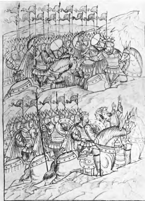
Рис. 9. Сбор войск на Куликовом поле. Видны сигнальные трубы. Миниатюра Никоновской летописи (II Остермановский том, стр. 195).

Дутреже поранокоршоу даря бубны . Исполни въ полне пон понде . а кон за