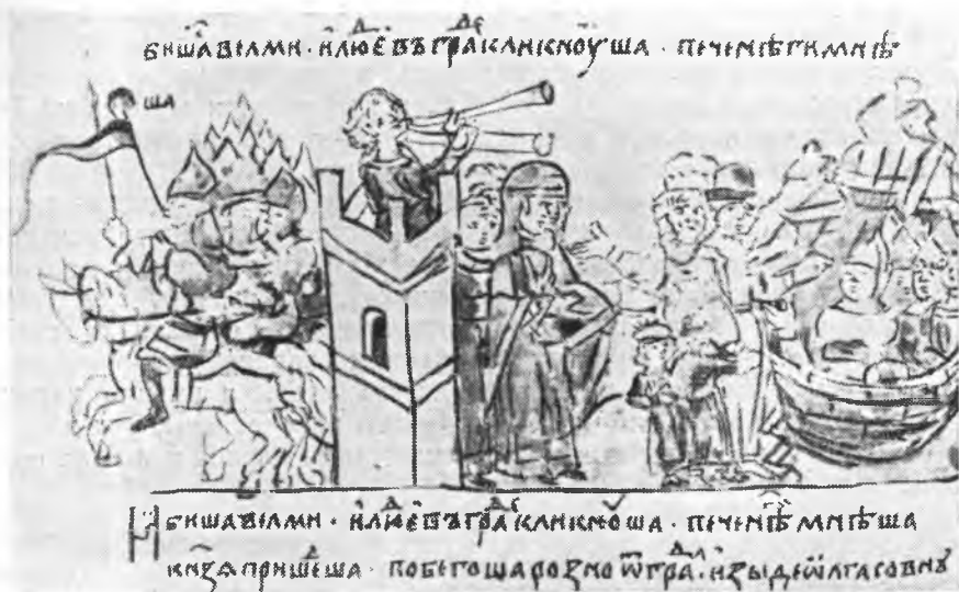
Рис. 1. Осада Киева печенегами. Миниатюра Кенигсбергской летописи (л. 35. лиц.)

Некоторые западноевропейские материалы также позволяют предположить, что численность войск могла определяться по числу имеющихся в них войсковых сигнальных инструментов 9 . Множество сигнальных инструментов отмечали в русском войске западноевропейские наблюдатели в разные времена. Так, Генрих Латвийский, сталкивавшийся с русскими войсками в XIII в., неоднократно отмечал в отрядах русских дудки и литавры. «Русские...,— пишет он в одном месте,— добрался до небольшой реки, перешли ее и остановились. Затем собрали вместе свое войско, ударили в литавры, затрубили в свои дудки и стали король псковский Владимир и король новгородский, обходя войско, ободрять его перед битвой» 10 . А на 300 лет