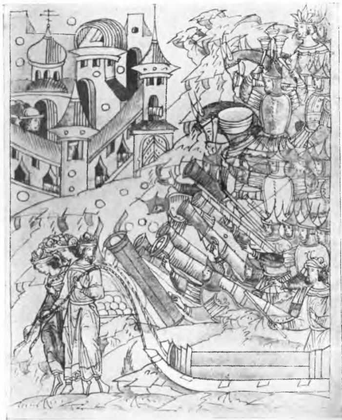
Рис. 12. Осада города. Видны литавры. Миниатюра Никоновской летописи (Голлицынский том, л. 757 лиц.)