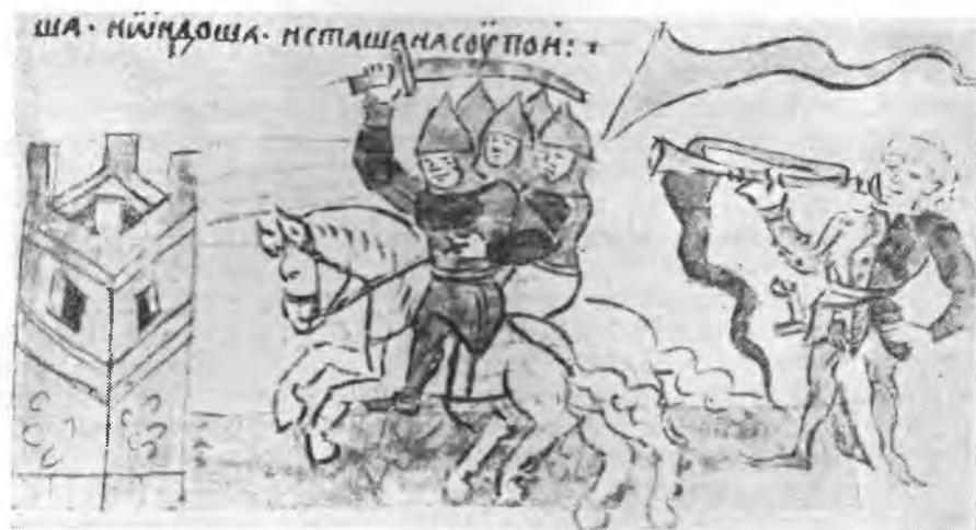
Рис. 4. Боевая сигнальная труба с прикрепленным к ней полотнищем. Осада Переяславля. Миниатюра Кенигсбергской летописи (л. 167 лиц. нижн.)

сании штурма г. Рязани князем Всеволодом в 1179 г. «Князь же Всеволод,— гласит летопись,— иде к Резаню и взя город борисов и глебов» 19 . На соответствующей миниатюре изображен штурм города. Бой, как видно, идет у крепостных ворот. Всеволод с войском врывается в город. На крепостной стене стоит трубач без шлема, в коротком платье, подающий какие-то сигналы в длинную прямую трубу (см. рис. 3). Если этот трубач принадлежит, повидимому, к осажденным (город еще не взят), то нередки изображения трубачей и на стороне осаждающих. Например, на миниатюре, изображающей осаду Переяславля Ольговицами, справа, вне стен крепости, нарисован трубач с трубой, напоми-