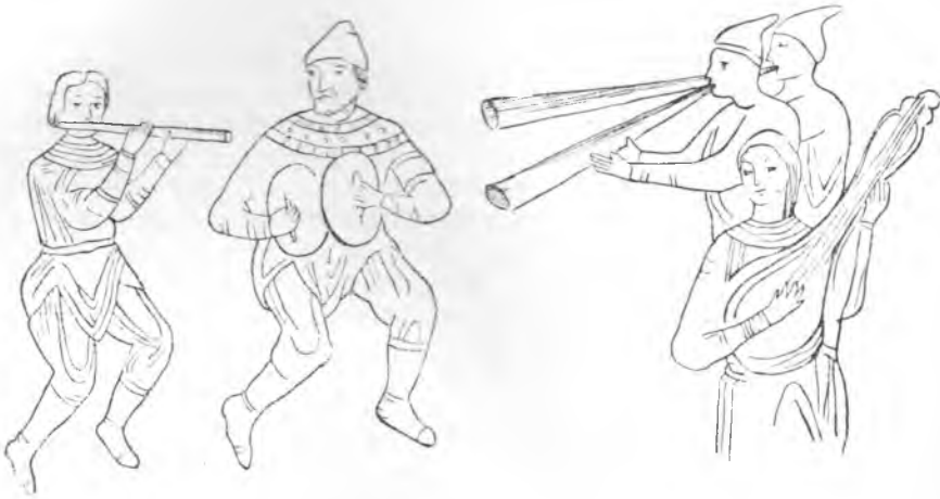
Рис. 6. Игры скоморохов (по фреске лестницы Софийского собора в Киеве). Прямые трубы. Поперечная флейта

чайно удобен для боевых сигналов, и поэтому совершенно естественно, что зурна имела в древнерусском войске значительное распространение. Позднее Флетчер также отмечал в русском войске зурны, называя их гобоями. Среди современных народных русских музыкальных инструментов зурна не встречена вовсе. Приводимые А. Л. Масловым экземпляры (№№ 154—160) все происходят либо из Средней Азии, либо с Кавказа 41 . Зурна, которую Маслов называет «родоначальником усовершенствованного гобоя», представляет собой деревянную трубку длиной 40—50 см, с раструбом и восемью отверстиями для пальцев. В верхний конец зурны вставлена узкая трубка, в которую вставляется еще одна медная трубочка, а на нее надевается еще тростниковый мундштук (см. табл. I). Нам представляется, что зурна не имела широкого распространения в быту древней Руси, а применялась главным образом для военной сигнализации.