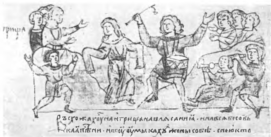
Рис. 5. Игрища славян-вятичей. Видны бубен и сопель. Миниатюра Кенигсбергской летописи (л. 6 об.)

Мы имеем все основания предположить, что богатый набор военных музыкальных инструментов русского войска состоял из тех инструментов, которые были общеупотребительны в народе. «У русских,— писал еще Н. Костомаров,— были свои национальные инструменты — гусли, гудки (ящики со струнами), сопели, дудки, сурьмы (трубы), домры, накры (род литавр), волынки, ленки, медные рога и барабаны» 28 . В этом перечне инструментов мы находим почти все названия, встречавшиеся нам прежде. Своеобразный оркестр русских народных инструментов изображен на миниатюре Кенигсбергской летописи, посвященной быту древнеславянских племен. «Въсхожахоуся на игрища, на плясания и на вся бесовская пени,— гласит летопись,— и тоу оумыкаху жены себе» 29 . В центре миниатюры пара танцующих — женщина в