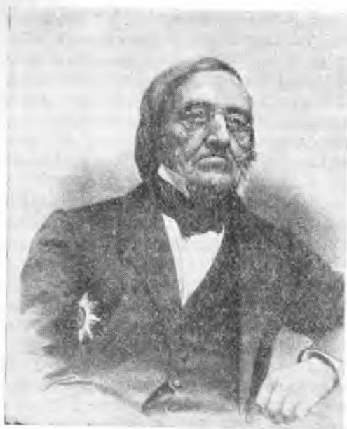
Академик К. М. Бэр.

сравнительной этнографии о различном характере и уровне культуры отдельных народов находят себе объяснение в данных географии. Выводы, сформулированные самим Бэром: «Сблизим теперь в кратких словах все высказанные нами мысли и наблюдения. Наклонение земной оси определяет количество теплоты, получаемой каждой частью планеты, от очертания суши и морей зависит дальнейшее распределение тепла и удобство или неудобство сообщений людей между собой; возвышение и понижение почвы, оказывая сильное влияние на низвержение воды из воздуха, определяет вместе с тем пути, по которым эта вода возвращается в море и образует естественные пути сообщения; хребты гор образуют и разъединяют народы, содержание тепла и воды (вообще климат) определяет производительность почвы и частью само собою,