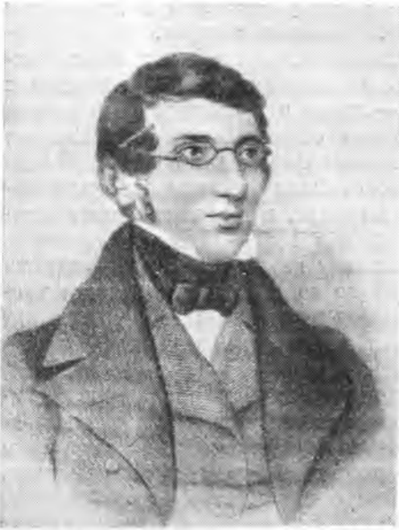
Н. И. Надеждин.

Обстановку в РГО в рассматриваемое время ярко отображают мемуары одного из крупнейших деятелей РГО — П. П. Семенова Тян-Шанского. Некоторый материал, правда ограниченный в силу официального характера издания, дает и его «История полувековой деятельности Русского Географического Общества», в которой изредка промелькнут, среди страниц «объективного», строго фактического изложения события, строчки мемуарного порядка. Семенов отмечает, что РГО, именно как Общество, а не как правительственное учреждение, «не было и не могло быть замкнутой корпорацией», оно «росло, развивалось и крепло непосредственно из русской общественной среды». Большое значение в жизни и деятельности РГО в 50-х годах приобрели «молодые силы» — прогрессивные общественные деятели, поставившие своей целью «способствовать своими независимыми трудами познанию русской земли и русского народа».