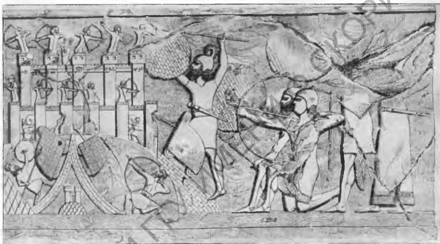
Рис. 2 Взятие ассирийцами манейской крепости на берегу оз. Урмии (Рельеф из дворца Саргона)

войску. Посетив Парсуа и Ману и приняв дань от стран Намри, Сангибуту, Мидии и Гизилбунды, Саргон направился походом на восток против страны Зикирту. Вступив на вражескую территорию, ассирийское войско приступило к разрушению поселений, брошенных местными жителями. Метати, правитель Зикирту, отступал вглубь страны, не принимая сражения. Во время преследования врагов Саргон узнал, что урартский царь Руса прибыл в область Уишдиш (на западном склоне горы Сохенд, восточный берег озера Урмии), которую он присоединил к Урарту. Саргон резко изменил путь своего войска и, оставив преследование Метати, форсированным маршем направился в страну Уишдиш. Среди ночи, в ущелье горы Уауш (гора Сохенд), он внезапно напал на урартский