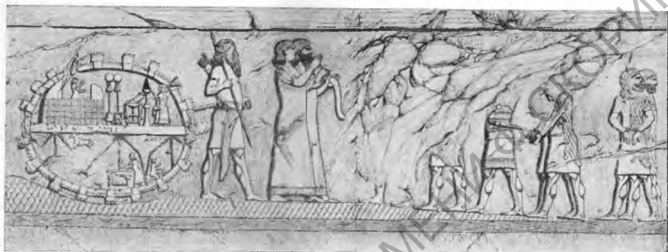
Рис. 1. Перепись пленных манейцев (Рельеф из дворца Саргона)

В 714 г. до н. э. Саргон снаряжает поход в страны, расположенные к востоку от озера Урмии. Этот поход нам хорошо известен, так как