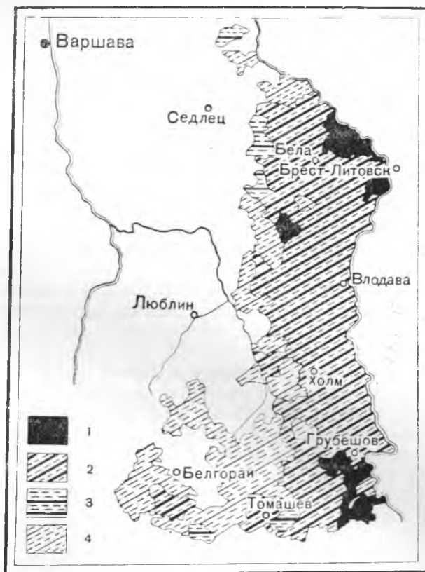
Схема 3. Расселение украинцев и поляков в Холмщине в начале XX в. (по Францеву).

этого края проживали украинцы, которые составляли древнейшее население Бессарабии. Территория быв. Хотинского уезда, где жили эти украинцы-старожилы, примыкала на северо-западе к этническому мас-