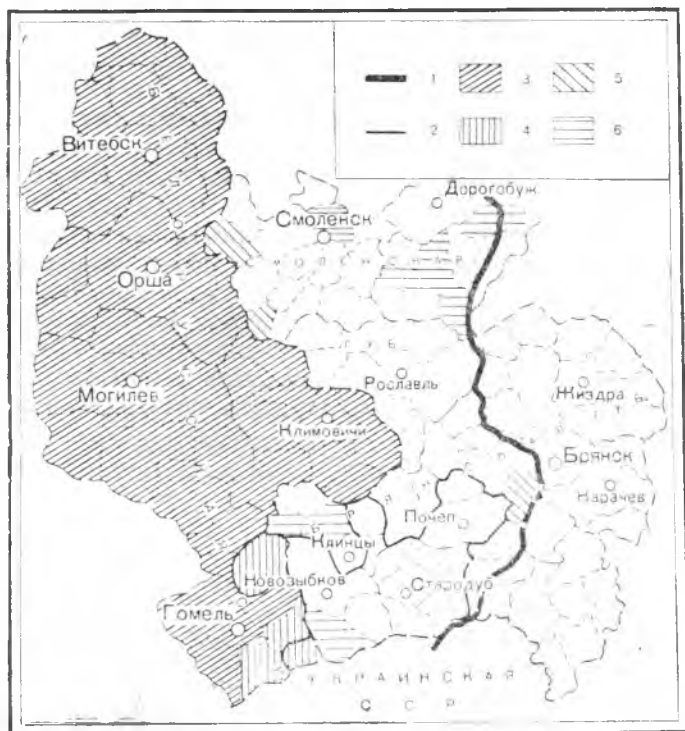
Схема 1. Восточная граница расселения белорусцев

Нанесенные на карту Е. Карского этнические границы белоруссов противоречат данным переписи 1897 г. На это можно возразить, что переписные данные не всегда обеспечивают правильное отображение национальных отношений, тем более, что в дореволюционных условиях представители угнетенных национальностей часто не имели возможно-