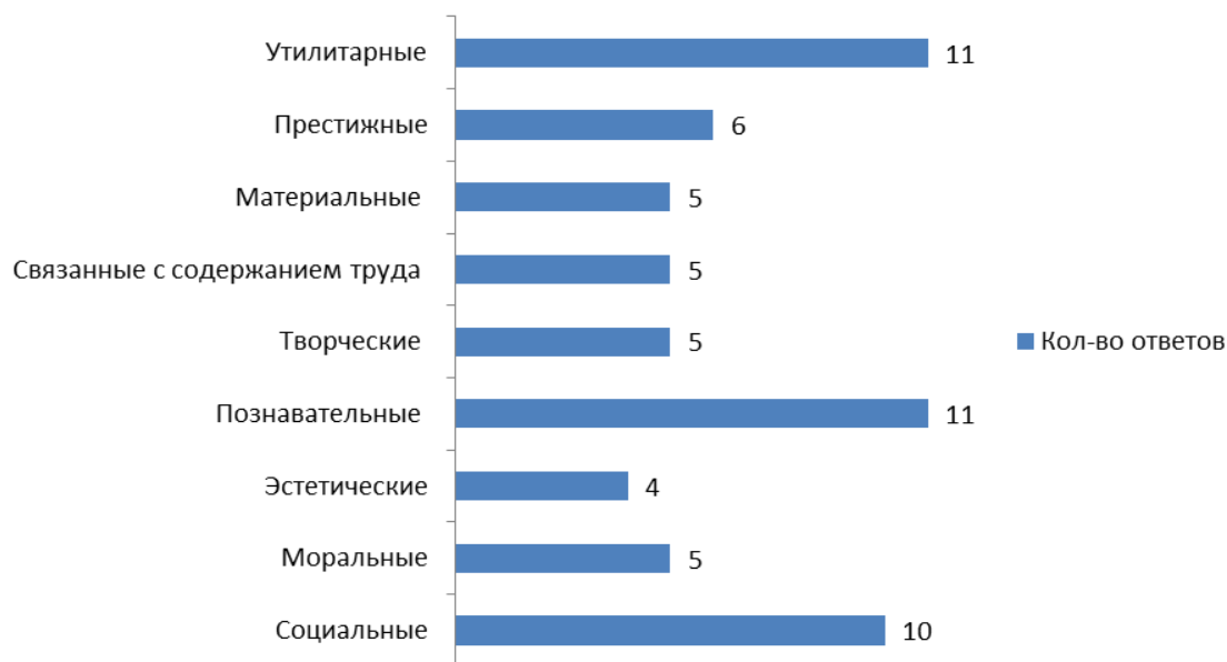
Рисунок 2 – Результаты теста основные мотивы выбора профессии (Е. М. Павлютенков)

Исследование выявило, что испытуемые преимущественно ориентированы на абстрактные ценности, такие как развитие и свобода, а также на личную жизнь и межличностные отношения, при этом профессиональная самореализация важна, но менее приоритетна по сравнению с семьей и общением. Значительное внимание уделяется этическим ценностям и принятию других людей. По методике Е. М. Павлютенкова большинство респондентов выделили утилитарные и познавательные мотивы выбора профессии, отражающие стремление к стабильности, практической выгоде и интеллектуальному развитию. Социальные и престижные мотивы также играют важную роль, свидетельствуя о значимости общественного признания и помощи людям. Моральные, эстетические, творческие и материальные мотивы имеют меньшую, но заметную роль в мотивации части участников (рисунок 2).