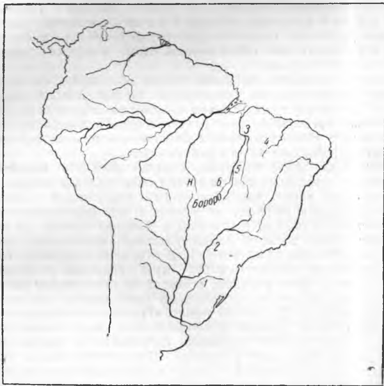
Племена группы же ; 1 — каинганг штата Санга-катарина; 2 — каинганг штата Сао-Пауло; 3 — апинаяе; 4 — рамкокамекра (канелья); 5 — шепенте; 6 — шаванте Н. Ньямбикуара

жалением автор признает полную неудачу своих попыток получить систему родства индейских наций Ю. Америки. Важность системы этих наций заключается в том, составляет ли она часть ганованской семьи». Для своей работы Моргану удалось получить лишь весьма неполные сведения о чибча Новой Гренады. С того времени о социальной структуре племен Южной Америки появилось немало сведений, но это были