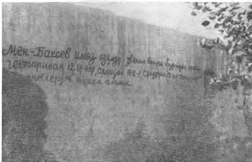
Рис. 9. Надпись на стене дома — социалистическое обязательство колхозного звена (Колхоз «Кызыл-Кыргызстан»)

Радиотрансляционные точки имеются уже во многих домах с. Чаек. На очереди — появление их во всех колхозах Джумгала. Патефоны проникли к колхозникам даже отдаленных артелей. В высокогорном колхозе «Кызыл-Октябрь» мы были очевидцами, с каким живым интересом (в который раз!) колхозники слушали пластинки патефона, принадлежащего бригадиру Жусупбеку Масыралиеву. У него имеются пластинки с записями песен на киргизском, казахском и русском языках.