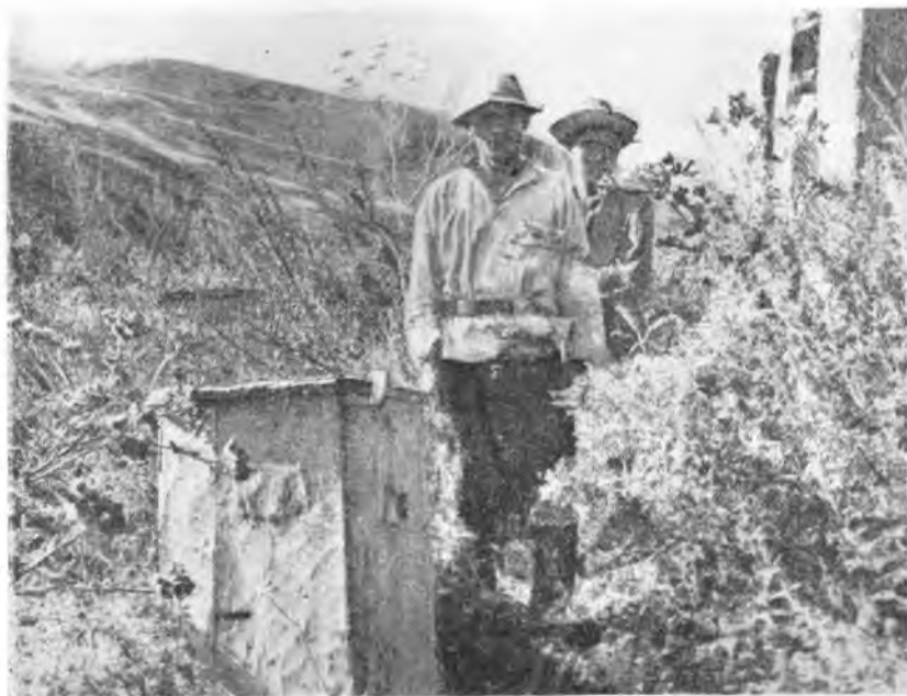
Рис. 3. Пасека колхоза «Бирлик»

Глубокие изменения в экономике киргизского хозяйства сопровождались коренным переустройством всего материального уклада жизни кочевников. Еще 30—40 лет назад долины рек Джумгала и Сусамыра и прилегающие к ним урочища представляли собой необозримые пустынные пространства с редкими признаками оседлой жизни. Лишь кое-где на зимних стойбищах можно было встретить небольшие хижины из камня, обмазанного глиной или глинобитные. Значительная часть населения круглый год жила в войлочных юртах. Теперь на этих же пространствах раскинулись десятки селений, построенных с помощью государства. Объединившись в колхозы, скотоводы переселились в проч-