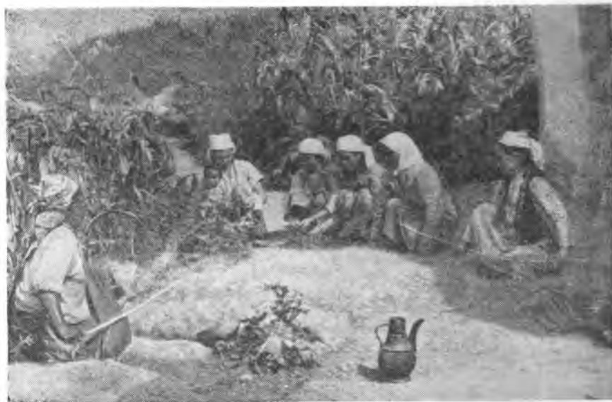
Рис. 7. Взбивание шерсти, идущей на приготовление войлоков. Ими покрывают юрты колхозных пастухов. Колхоз «Кызыл-Октябрь»

шим потребностям. В колхозе «Кызыл-Кыргызстан» заканчивается строительство нового здания — самого крупного в селении после шко-