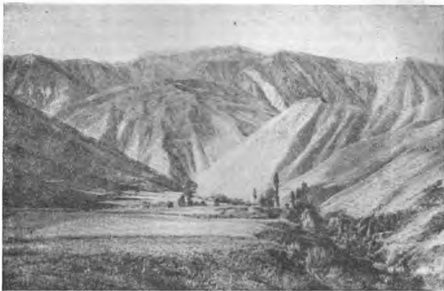
Рис. 6. Поселок Чонз-таалга, в котором живет одна из бригад колхоза «Кызыл-Октябрь»

ный и продовольственный склады, кузница, хозяйственный двор; на последнем хранятся строительные материалы и сельскохозяйственные машины. Имеющиеся помещения часто уже не соответствуют возрос-