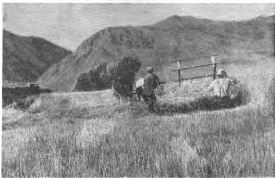
Рис. 2. Уборка зерновых культур. Колхоз «Орто-кууганды»

Одним из ярких показателей глубочайших изменений в организации хозяйства, свидетельствующих об его интенсификации на социалистической основе, служит широкое развитие травосеяния и массовые заготовки сена. Из года в год колхоз «Кызыл-Кыргызстан» производит заготовки сена на естественных сенокосах площадью в 742 га. Площадь