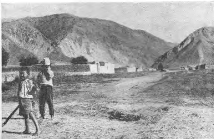
Рис. 5. Улица в колхозе «Орто-куганды»

ная больница и амбулатория. Новое селение Чаек возникло на той площади, которую в прошлом занимала обширная усадьба крупнейшего в