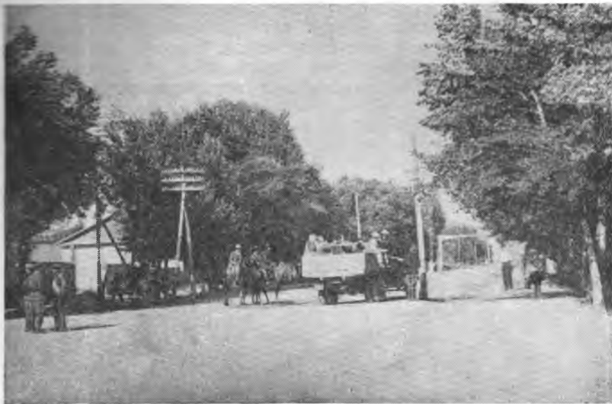
Рис. 4. Улица в селении Чаек — центре Джумгалского района

школа с интернатом (ее возглавляет молодой воспитанник Киргизского педагогического института т. Ниязов), постройки Райпромкомбината, производственные помещения колхоза. Дальше, среди густого сада — район-