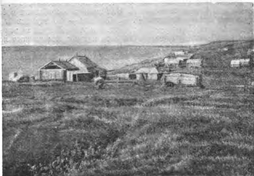
Рис. 3. Вид на жилые дома колхоза им. Кирова в поселке Воронцово

Иногда в обстановке сказываются старые русские традиции — лавки вдоль стен, стол в красном углу и т. п. Есть семьи, которые живут так же, как и соседние с ними семьи русских рабочих и служащих.