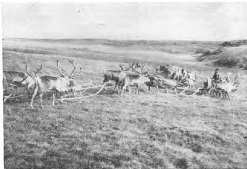
Рис. 2. Отправление охотничьего звена колхоза им. Кирова. Осень 1948 г.

В будущем, когда ежегодная выбраковка оленей охватит не 3—4% поголовья (как сейчас), а 10—15%, оленеводство, даже не считая его транспортных услуг, несомненно, станет одной из самых доходных отраслей хозяйства колхоза.