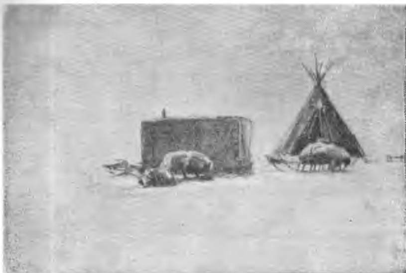
Рис. 5. Балок и чум в тундре близ Воронцово. Осень 1948 г.

Енисеем или пригоняют оленей (как своих, так и выделенных колхозом), а охотники уходят в тундру. Там они располагаются группами по несколько в районах охоты, время от времени сменяя пастбище. В отличие от оленеводов, охотники всю зиму остаются в одном определенном районе, не уходя на юг. Передвижения охотников представляют новый тип специальной промысловой организации быта. В последних числах апреля охотники сдают оленей пастухам и располагаются на берегу Енисея. В мае-июне они занимаются еще охотой на гусей, а с июля начинается рыболовный сезон. Лето рыбаки живут оседло на местах промысла. Переезды с мест весновок на рыболовные пески и обратно к