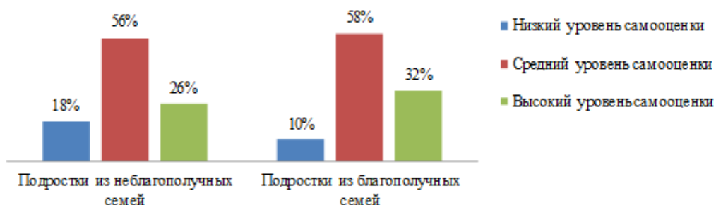
Рисунок 2 – Сравнительный анализ уровня самооценки у испытуемых из неблагополучных и благополучных семей (в%)

Рассматривая данные, представленные на рисунке 2, мы наблюдаем схожее распределение среднего уровня самооценки у испытуемых из неблагополучных и благополучных семей. Тем не менее, испытуемые из неблагополучных семей обнаруживают склонность к более выраженной низкой самооценке, в то время как испытуемые из благополучных семей демонстрируют тенденцию к проявлению высокой самооценки.