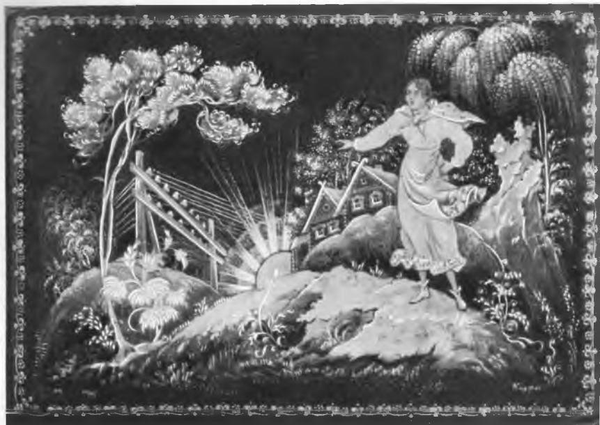
Рис. 3. «Зашумели, заиграли провода». Работа Ф. А. Коурцева, 1946. Коробочка