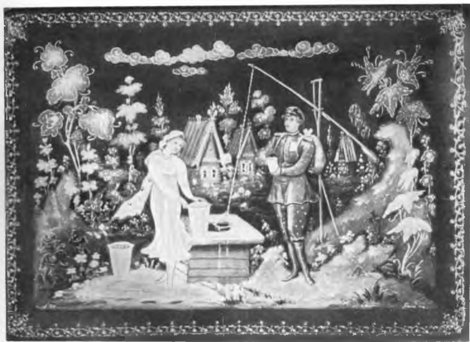
Рис. 4. «Шел со службы пограничник». Работа С. Д. Солонина. Шкатулка