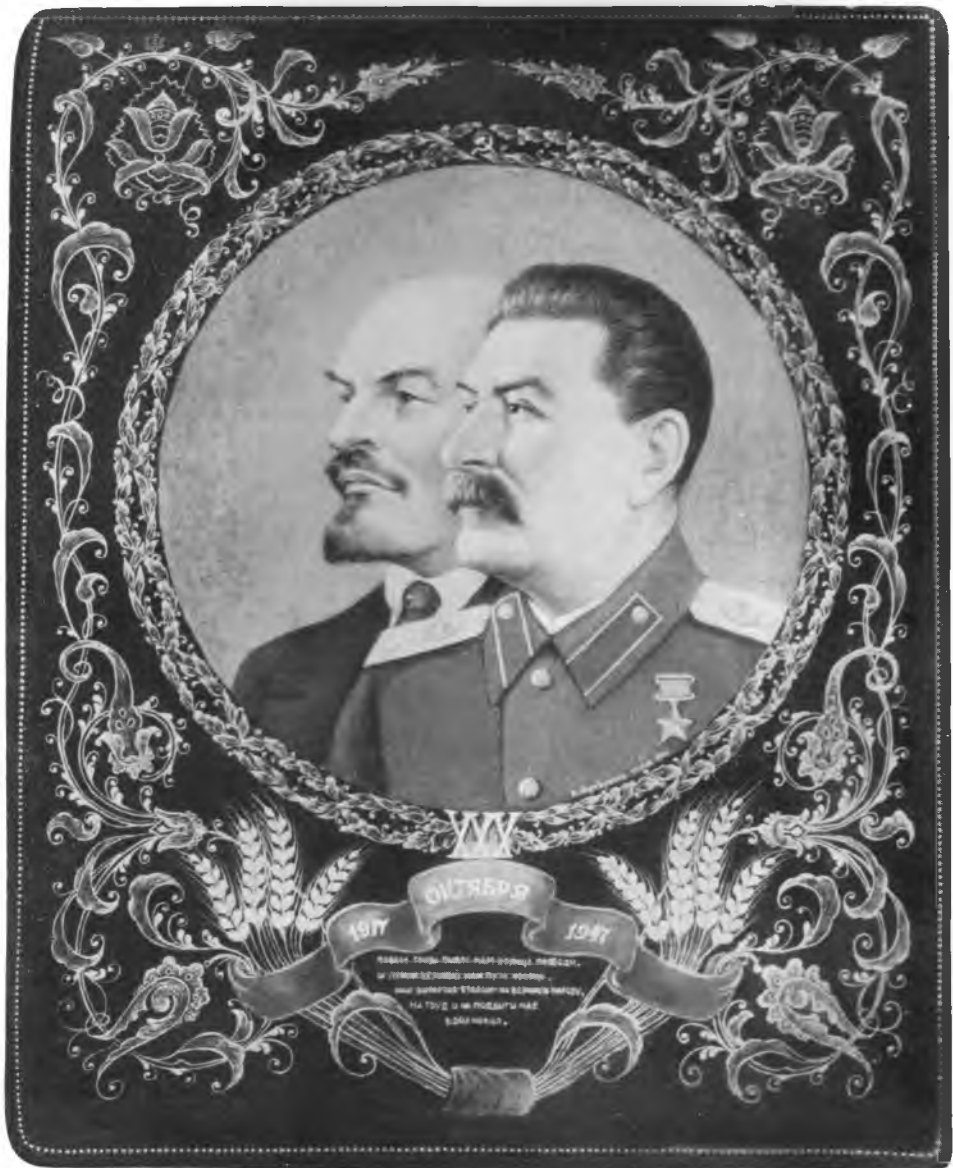
Рис. 1. Ленин и Сталин. Работа И. Г. Серебрякова, 1947. Шкатулка