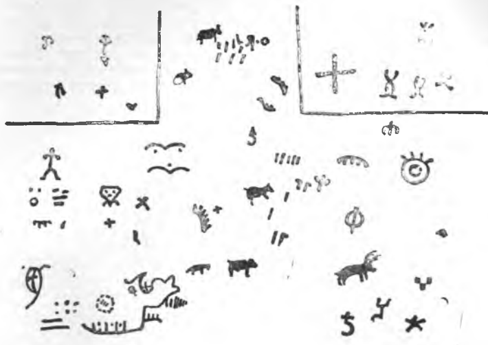
Рис. 2. Писаница на р. Вендере в Верхнекамском округе (по А. А. Берсу)

Балабана, елсчки, зигзаги, кресты и т. д. Часть поверхности камня целиком закрашена, что наблюдалось на Змеевом камне. Под писаницей в скале находится пещера, где при раскопках найдены бронзовый наконечник копья и каменный пест, повидимому, эпохи бронзы. Н. А. Прокошев отмечает обычность сочетания писаниц и пещер на Урале, приводя еще пример Алапаевской пещеры с предананьинским материалом, находящейся близ разрушившейся писаницы 17 .