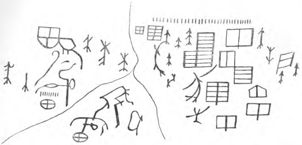
Рис. 4. Писаница на р. Смолянке близ Усть-Каменогорска (по Г. И. Спасскому)

Кроме этих, имеется ряд неопубликованных изображений, нанесенных красной краской на скалах по рр. Вишере, Туре, Реже, Нейве, Ивдели. Составивший их список В. А. Весновский упоминает рисунки медведя, лисы, оленя (т. е. зверей, изображенных на Тагиле и Венлере) и ряды «резких линий» 21 . В Башкирии в пещере у с. Идрисова на р. Юрезани известна еще одна группа нанесенных красной краской схематических, «напоминающих человеческие фигуры линейных изображений» 22 . Имеются сведения о писаницах с изображением зверей в пещерах Башкирии. Сведения обо всех этих писаницах не противоречат нашей датировке относящихся к той же группе тагильских изображений. Напротив, еще более точные аналогии с Каре-