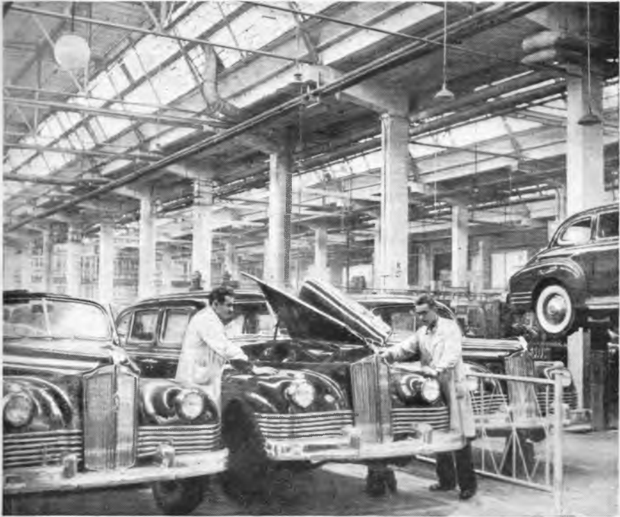
Рис. 1. В цехе сборки легковых автомашин завода им. Сталина

живает внимания одна деталь: ночная смена работает не восемь, а семь часов. Таким образом, самый график рабочего дня построен с учетом более трудных условий работы в ночное время. Еженедельно происходят передвижка смен, так что больше шести дней подряд рабочие ночью не работают. Рационально организованы обеденные перерывы. На заводе имени Сталина перерыв часовой; на Трехгорной мануфактуре — 20-минутный. Однако на обоих предприятиях рабочие вполне успевают пообедать в это время, так как здесь же, при цехах, существуют столо-