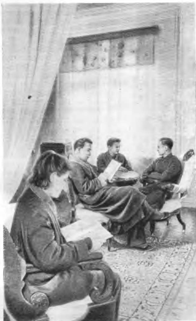
Рис. 2. В читальне цехового профилактория завода им. Сталина

Большую роль в непрерывном улучшении условий труда играет также медицинское обслуживание рабочих, происходящее частично на самом производстве. И на заводе имени Сталина, и на Трехгорной мануфактуре развернута сеть цеховых здравпунктов, находящихся под