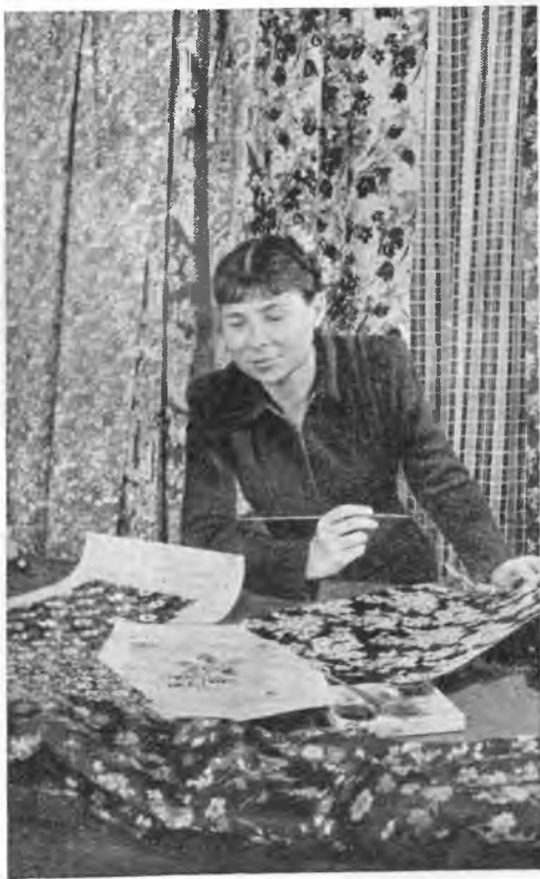
Рис. 5. В художественной мастерской комбината Трехгорной мануфактуры. Работа над новыми рисунками для тканей

Много рабочих на ЗИС проходит обучение также непосредственно в основных цехах в специальных стахановских школах, которые представляют собой совершенно новое явление в производственной жизни завода, возникшее только в годы послевоенной сталинской пятилетки. Существует два вида стахановских школ — индивидуальные и коллективные. Индивидуальным обучением охватываются отстающие рабочие, не выполняющие нормы или дающие большой процент брака. В качестве преподавателей привлекаются мастера и лучшие стахановцы; между ними и обучающимися рабочими заключаются индивидуальные договоры, которые предусматривают передачу стахановского опыта передовиков отстающим в течение одного месяца. В 1949 г. таким путем было подготовлено 1910 квалифицированных рабочих. При коллективном обучении, которым также руководят передовики производства, состав-