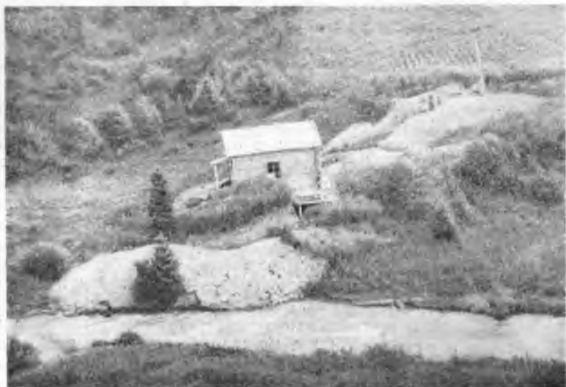
Рис. 5. Электростанция колхоза имени Сталина Кегеньского района

Так, в колхозе «Бельбасар» на наиболее трудоемкой культуре — сахарной свекле — занята особая бригада. Бригаде отводится определенный участок поливной земли, за обработку и полив которого и получение с него высокого урожая свеклы бригада несет полную ответственность. Работа в свекловичной бригаде считается особенно почет-