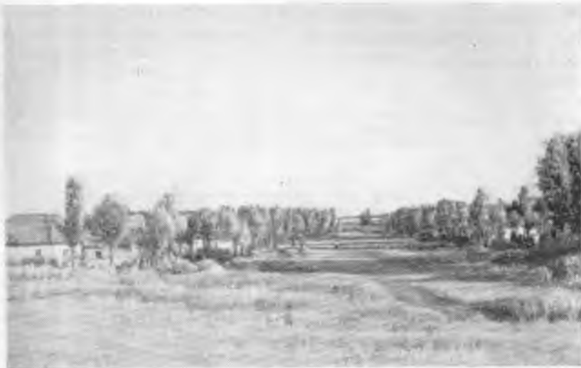
Рис. 6. Улица в поселке колхоза «Бельбасар»

К дому обычно примыкает хозяйственная постройка — ат-кора или сыйыр-кора (помещения для лошади или коровы), стены которой сложены из бревен, крыша — плоская. Иногда эта пристройка представляет собой простой навес для скота, называемый лапас.