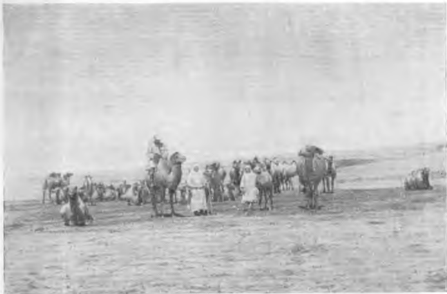
Рис. 4. На верблюдоводческой ферме колхоза «Бельбасар» Чуйского района Джамбулской обл.

В животноводстве казахских колхозов указанных районов приняты отгонно-пастбищная система и сезонный выпас скота. Нагульный скот, находящийся на отгоне, содержится, как правило, на далеких расстояниях (иногда в 100 км и больше) от поселка и в последний за редкими исключениями не пригоняется. Годичный цикл включает 4 перегона на