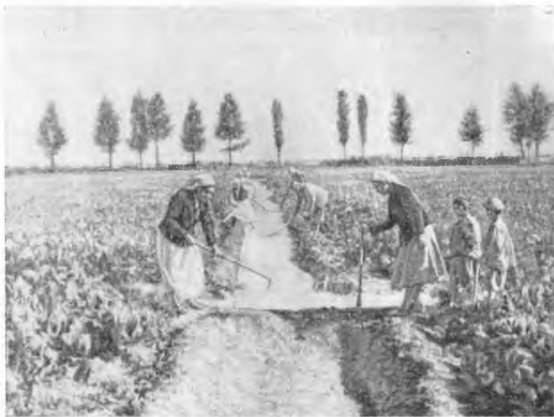
Рис. 2. Полив свекловичного поля в колхозе «Бельсар», под руководством Героя Социалистического Труда Тунгатаровой Куляй

ных сельскохозяйственных машин МТС руководят всеми агротехническими мероприятиями; они определяют сроки полевых работ, следят за их своевременным и высококачественным выполнением, снабжают колхозы минеральными удобрениями и т. д. Большое значение имеет работа