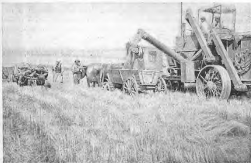
Рис. 1. Уборка пшеницы комбайном в колхозе «Бельбасар»

Основное направление хозяйства обследованных колхозов — животноводческое, в сочетании с развитым полеводством. На богарных (неполивных) землях сеют пшеницу, ячмень, просо, кукурузу, на поливных — главным образом свеклу, являющуюся в настоящее время одним