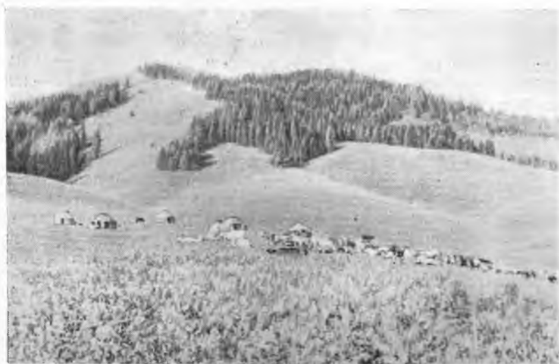
Рис. 3. Летнее пастбище колхоза им. Сталина Кегенского района Алма-Атинской обл.

МТС по подготовке кадров и повышению квалификации агрономов и механизаторов сельского хозяйства; при многих МТС существуют школы механизации, курсы подготовки и переподготовки трактористов, комбайнеров, бригадиров и т. п.; работники МТС выезжают в колхозы с лекциями и докладами на агрономические темы. В результате во многих