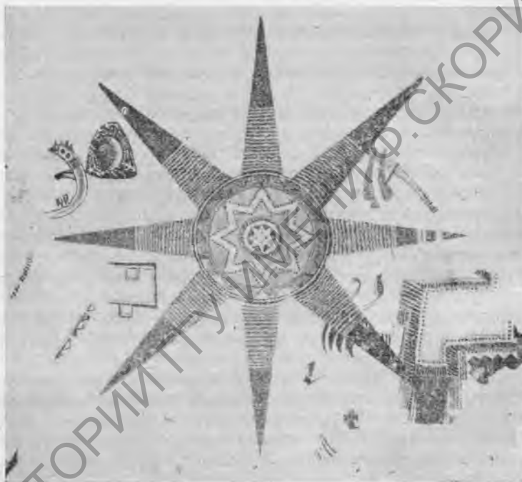
Рис. 2. Стенная живопись, представляющая солнечный диск, в Телл-э-Файе в Заиорданье (2-я пол. IV тысячелетия до н. э.)

Находки энеолитической керамики, открытые в Мегиддо и в других местах, показывают удивительное сходство как с керамикой Малой Азии, так и с керамикой додинастического Египта, например черные полированные сосуды, темнокрасные сосуды с врезанным орнаментом, м. б. заполненным белой краской, что, между прочим, встречается и в неолитической критской керамике; палестинские горизонтальные, часто волнистые ручки сосудов IV и III тысячелетия до н. э. переносятся в додинастическое время