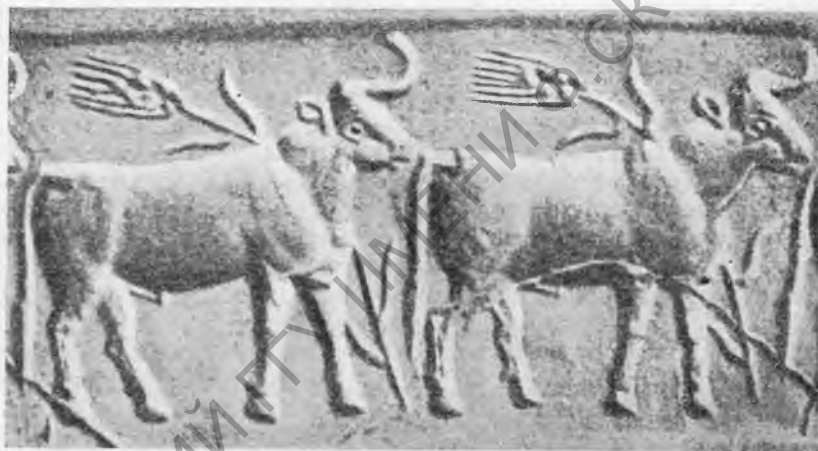
Рис. 4. Бык с колосом (изображение на цилиндре-печати периода Джемдет-Наср, 3200—3000 гг. до н. э.)

У р у к с к и й и д ж е м д е т - н а с р с к и й п е р и о д ы. Следующей стадией древнейшей вавилонской истории является урукский период, который назван так по своему центру—южноавилонскому городу Уруку, библейскому Эреку, и который можно отнести приблизительно к 3400—3200 гг. до н. э. Одним из его главных признаков является замена раскрашенной обеидской керамики простыми красными, серыми или черными сосудами, иногда гравированными, которые, по всей вероятности, происхо-