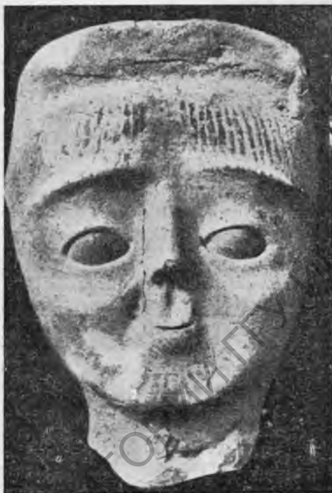
Рис. 1. Глиняная голова мужчины из Иерихона (начало IV тысячелетия до н. э.)

высыхание земной коры вынуждало человечество и диких еще зверей к более тесному сожителству в долинах у источников и рек. Уже эти первые находки собаки в Палестине указывают, возможно, на северное происхождение этого палестинского населения, на приход его из области Кавказа или Каспийского моря. Своих покойников эти люди хоронят или в скорченном положении, на боку, или в прямом положении, на спине, или из страха перед покойниками сжигают их. На голове или на шее у покойников—иногда украшения, изготовленные из ракушек, называемых декталлиями, или из костей, похожих на оленье клыки. Неполные человеческие скелеты и силой переломанные кости могут указывать на то, что