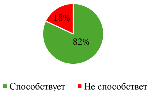
Рисунок 2 – Влияние универсиад на популяризацию студенческого спорта

Основным фактором, способствующим участию студентов в универсиадах респонденты отметили поддержку университета, что отражает рисунок 3.