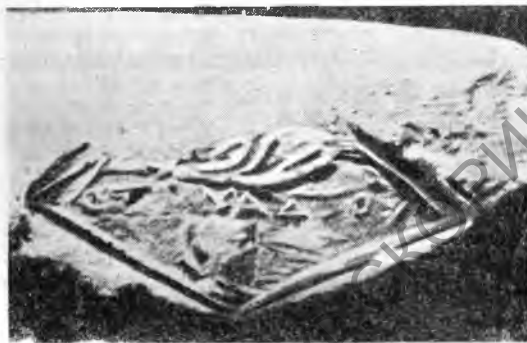
Рис. 2. Клеймо в форме ромба. Эмблема—голова Афины

Форма родосских клейм по большей части бывает или круглая, или прямоугольная, другие формы редки. Встречаются еще формы ромба, например, в клеймах из Линды (рис. 2) и плющевого листа (рис. 3).