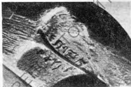
Рис. 3. Клеймо в форме листа плюща

Круглые клейма всегда располагаются симметрично на обеих ручках амфоры, притом с одинаковой эмблемой. Это наблюдение сделано было М. Нильсоном на основании известных ему целых амфор 3 . В круглых клеймах преобладают две эмблемы, которые встречаются постоянно на монетах Родоса,—цветок граната (рис. 4) в профиль и голова Гелиоса прямо или в три четверти. На монетах Родоса голова Гелиоса ставилась на лицевой стороне монеты, а изображение цветка—на оборотной.