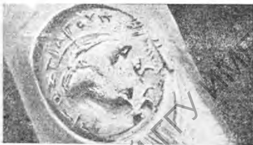
Рис. 4. Круглое клеймо. Эмблема—цветок граната

В четырехугольных клеймах, которых значительное большинство, эмблемы не-обязательны. Многие клейма вообще не имеют их. Иногда эмблема отсутствует на обоих клеймах амфоры, иногда стоит только на клейме с именем эпонима, иногда только на клейме с именем второго лица, и, наконец, одна и та же эмблема—на обоих клеймах 1 .