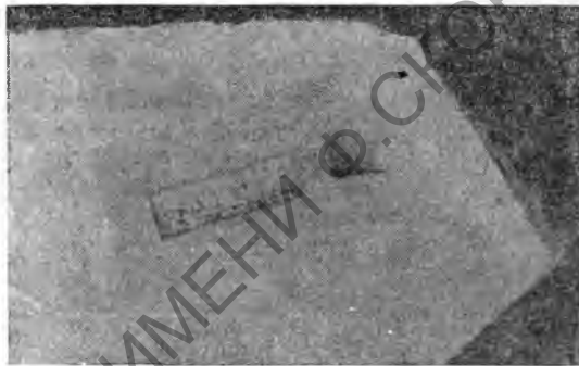
Рис. 1. Фрагмент черепицы с клеймом херсонесского астинома (№ 5860)

Большая часть черепицы покрыта желтовато-светлой обмазкой. Черепичные клейма Херсонеса в большинстве случаев с точностью совпадают с клеймами на херсонесских амфорах. Такое совпадение объясняется тем, что клеймение амфор и черепиц производилось одними и теми же штампами. Почти все клейма магистратов (за исключением единичных случаев) сопровождаются клеймами мастеров в виде монограммы или начальных букв их имен. Они врезаны или в штампе магистрата, или в существовавших для них отдельных небольших штампах, которые ставились рядом с клеймом магистрата.