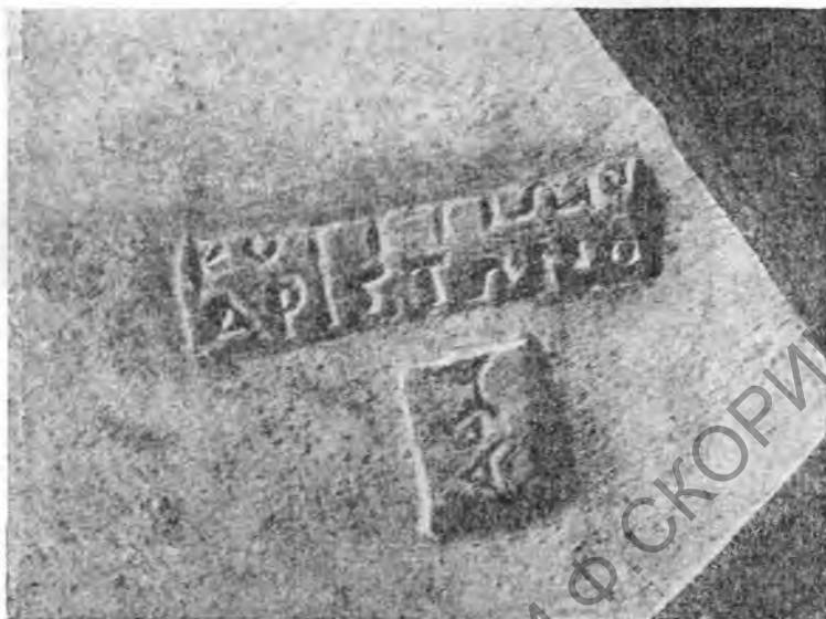
Рис. 3. Черепица херсонесского производства № 5689

Встречается на амфорных ручках (Е. М. Придик, № 854).