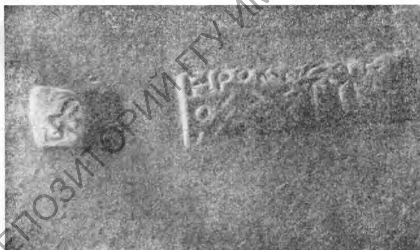
Рис. 2. Клеймо астинома № 5673

Фрагмент черепицы. 1 экземпляр. Из раскопок 1935 г. (инв. 634, 1935 г.).