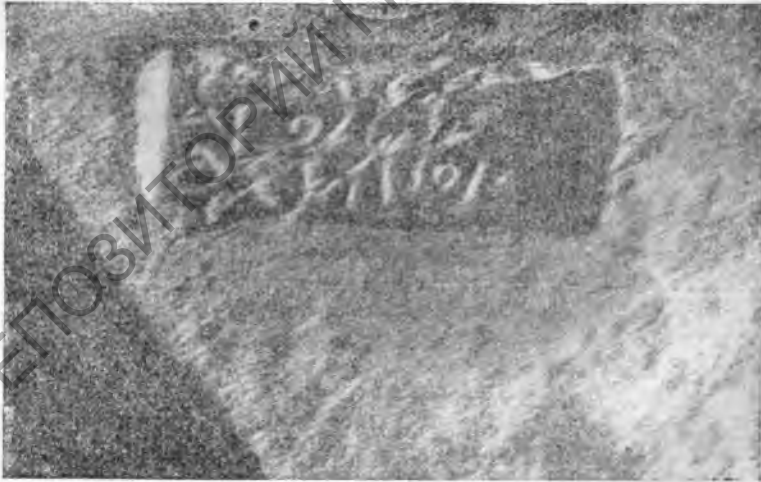
Рис. 4. Клеймо астинома № 5674

Фрагмент черепицы (рис. 4). 2 экземпляра (по описи 2975/10 и 35275/100). ИТУАК, вып. 47, стр. 126.