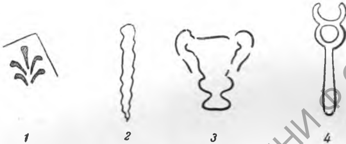
Рис. 6. Анэпиграфические клейма на гераклейских амфорах: 1—пальметта; 2—палица; 3—канфар; 4—кадуцей

Гераклейские клейма вообще очень бедны эмблемами, и подобные анэпиграфические клейма встречаются сравнительно редко; поэтому нахождение четырех подобных клейм в числе небольшой группы, состоящей всего из 11 экз., может быть объяснено принадлежностью их ограниченному кругу мастерских, о чем свидетельствует и однотипность форм сосудов.