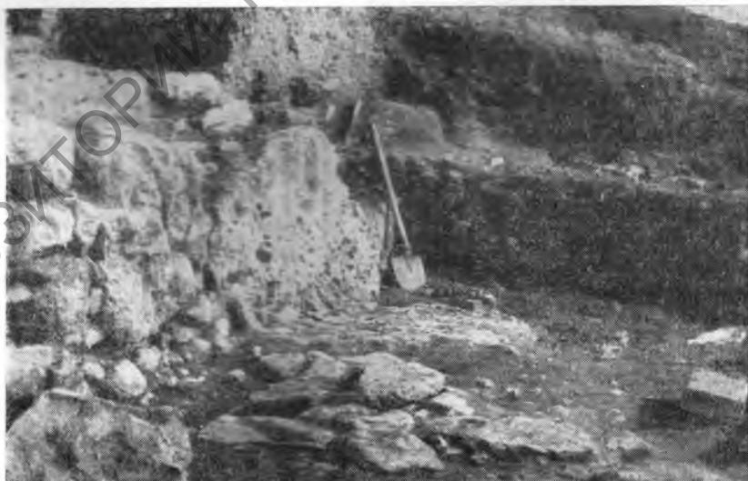
Рис. 5. Деталь подпорной стены дворика

наиболее крупные из них грубо отесаны с одной внешней стороны. С северной стороны к двору примыкало крытое помещение, пол которого находился ниже уровня двора на 0,5 м. В стене, смежной со двором, имелся дверной проем с лестницей в три