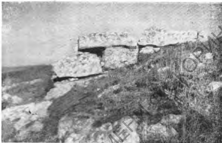
Рис. 2. Крепостное сооружение на плато

На плато сохранились развалины крепости, защищавшей наиболее отлогий восточный склон, откуда спускается длинная оборонительная стена, доходящая до берега моря. Эта так называемая «Восточная» стена сложена из огромных камней, образующих два панцыря, и укреплена на всем своем протяжении (около 500 м) пятью башнями. Толщина стены — 2,5—3,0 м.