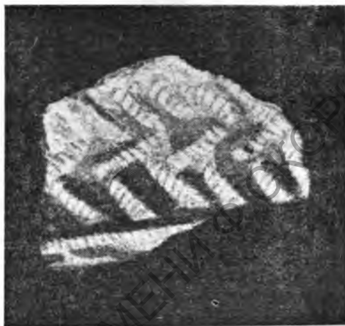
Рис. 8. Фрагмент сосуда (катакомбная культура)