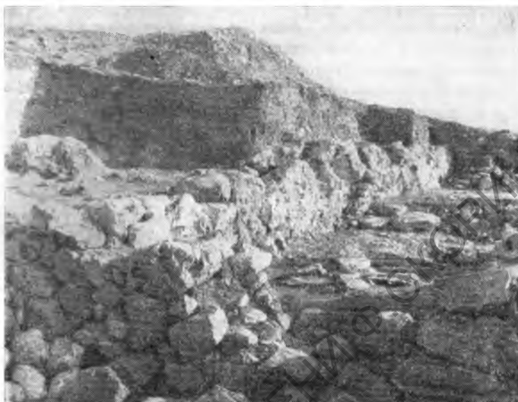
Рис. 4. Здание на Змеином холме со стороны дворика

на северо-западном склоне холма и состояло из нескольких помещений, сгруппированных вокруг открытого мощеного двора (рис. 4). С восточной стороны двор был ограничен подпорной стеной № 1, выложенной из камней различной величины: