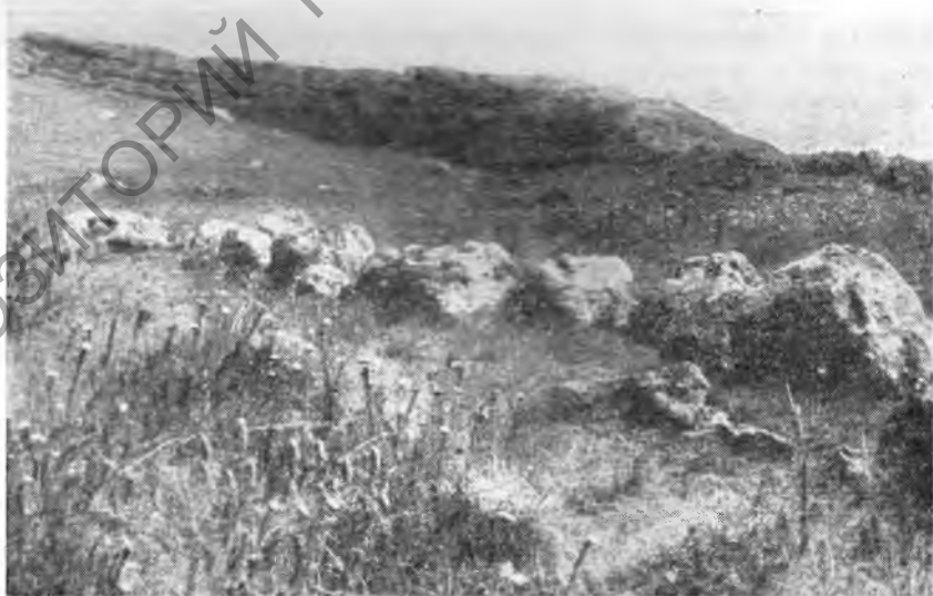
Рис. 3. Стена-ограда вокруг Большого холма

На плато, вдоль его восточного края, тянется другая стена, сложенная из таких же огромных, почти необработанных камней местной породы. С внутренней стороны